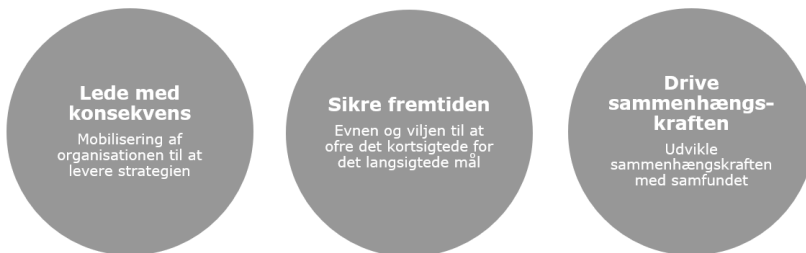
Figur 2. De tre karakteristika, som alle stewardship-ledere deler.

Ledere er både menneskelige og sårbare over for hovmod i forhold til vækst, profit og succes. Sårbarheden bliver måske større i takt med, at verden bliver stadig mere forbundet, og som leder er det let at lade sig påvirke af nye tendenser og strømninger i et stort hav af muligheder. Ledere kan dermed blive ofre for deres egen succes eller bliver fortryllet af egne synspunkter. Hvis man vil være en virksomheds steward, må man derfor have dyb indsigt i virksomhedens historie, udvikling og værdier.